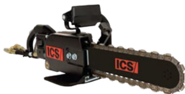
880F4 - 30 oder 45 l/min