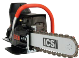
680GC - 80 ccm