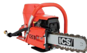
603GC - 64 ccm