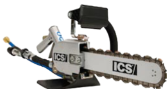
814PRO - 30 l/min