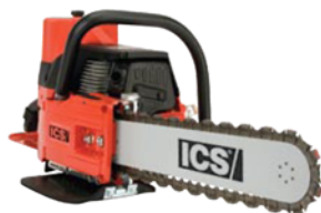
633GC - 101 ccm