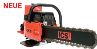
633F4 - 101 ccm